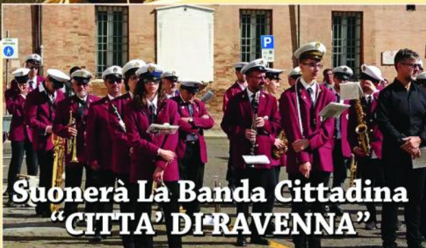
Suonerà La Banda Cittadina "CITTA' DI RAVENNA"